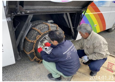
チェーン巻き講習