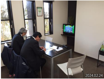
ドライブレコーダーを使った講習